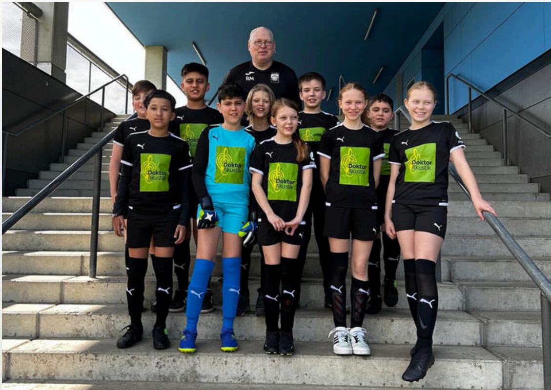
Nachwuchs- Saison 2023/2024

Trainerinnen: Maxi Oestreich Cheyenne Tschiedel 0176 61679540 maxi.oestreich@fsvlokdd.de